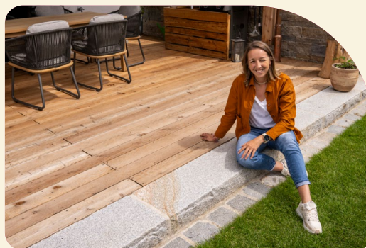
^ Spitzensportlerin Franziska Preuß hat ihren Lieblingsplatz im Freien kreiert: Lärchenholz ist ihre Wahl für die Terrasse.

So hat die italienische Biathletin Wierer in ihrem Zuhause für jeden Bereich das Optimum gefunden. Dominierend ist der Parkettboden, der einen fließenden Übergang zwischen Eingangsbereich, Wohn- und Esszimmer sowie der offenen Küche bildet. Auch an den Wänden und der Decke verleihen Akzente aus Parkett dem Raum eine sehr gemütliche Atmosphäre.