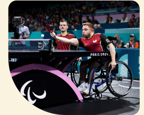
Baus und Schmidberger feierten ihren größten Erfolg als Doppel und gewannen ihrer Silbermedaille trotz der Niederlage gegen die Chinesen viel Positives ab: „Wir wissen, dass wir Großartiges geleistet haben.“