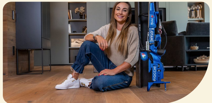
^ Rückzugsort nach dem Sport: Top-Athletin Dorothea Wierer hat bei der Ausstattung ihres Zuhauses auf JOKA Produkte gesetzt.

Die W. & L. Jordan GmbH ist einer der führenden Anbieter von Bodenbelägen, Türen, Holz, Holzwerkstoffen, Sonnenschutz und Wohnstoffen für den gehobenen Wohn- und Objektbereich in Mitteleuropa. Mit einem Fokus auf modernem Design, Funktionalität und Nachhaltigkeit hat sich das Unternehmen international einen Namen gemacht.