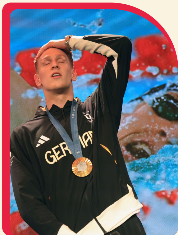
^ Moment für die Ewigkeit: Olympiasieger Lukas Märtens auf der Hauptbühne im Deutschen Haus. „Ich kann das alles noch gar nicht glauben“, so der 22-Jährige.