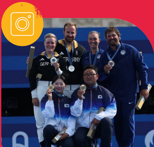
Deutscher Schützenbund (DSB) deutscherschuetzenbund

DA IST DAS DING #dsbteamapris @worldarchery