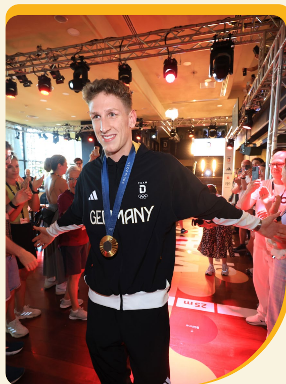
^ Jetzt. Für immer. Sechs Tage nach seinem Gold-Coup über 400 m Freistil kommt Lukas Märtens ins Deutsche Haus. Beim Medal Walk wird der Schwimm-Star richtig abgefeiert.