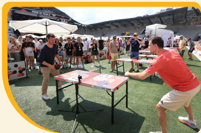
^ Fan Zone Duell: Der zweimalige Olympiazweite Timo Boll und Ex-Ski-Ass Felix Neureuther liefern sich einen packenden Fight an der Platte. Für den Tischtennis-Profi ist es eine kleine Vorbereitung auf den olympischen Team-Wettbewerb. Für Boll, der 2016 in Rio de Janeiro die deutsche Fahne trug, ist es der letzte internationale Wettkampf.