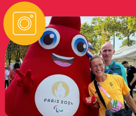
Elke van Engelen @paratriathlet_elke_vanengelen Die Spiele sind eröffnet! Vive les Jeux Paralympiques! Was für ein Fest der Nationen! Ich bin stolz, dabei zu sein! 01. September 2024