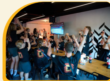
↗ Jubel über die ersten beiden Goldmedaillen von Team D Paralympics.