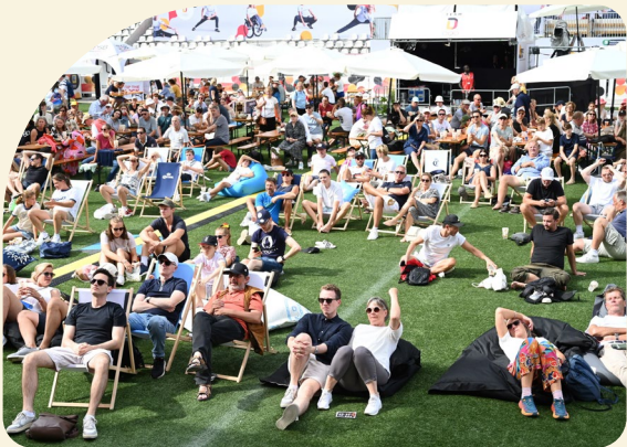
^ Sonnenschein und Entspannung pur. So macht Public Viewing richtig Spaß.