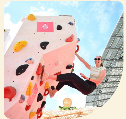
^ Hoch hinaus mit der Sparkasse. An der Boulderwand auf der Fan Zone sind die Kletterkünste gefordert.