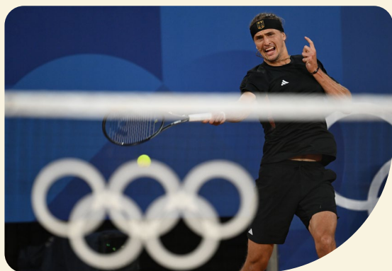
^ Kuriose Auslosung: Olympiasieger Alexander Zverev trifft nach seinem souveränen Auftaktsieg gegen den Spanier Jaume Munar gleich zweimal auf den Tschechen Tomas Machac. Zunächst im Mixed an der Seite von Laura Siegemund, dann in der zweiten Runde des olympischen Einzelturniers.