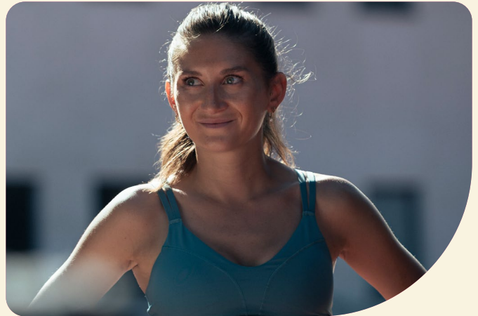
▲ Gesa Krause

Ihre Live-Formate senden die Streamerinnen und Streamer über Twitch.tv, ergänzt durch Highlights etwa auf ihren YouTube oder TikTok Kanälen. Diese und viele weitere Contents rund um die Olympischen Spiele 2024 findet ihr in unserem Content Hub .