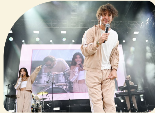
^ Verdienter Applaus für Fresh Music Live nach dem Konzert auf der Fan Zone-Bühne.