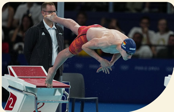
^ Auf dem Sprung zur nächsten Medaille? Olympiasieger Lukas Märten erreichte als Viertschnellster das Finale über 200 m Freistil.