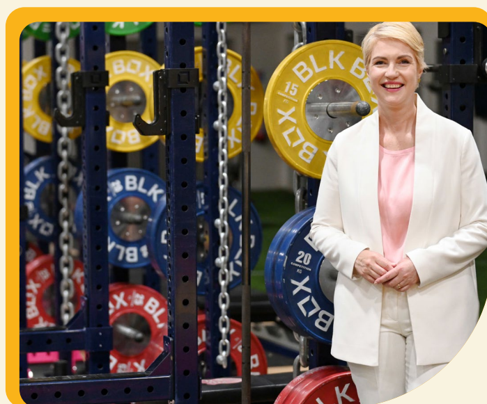
^ Mecklenburg-Vorpommerns Ministerpräsidentin Manuela Schwesig ist begeistert von den Trainingsmöglichkeiten im Performance Hub des Deutschen Hauses.